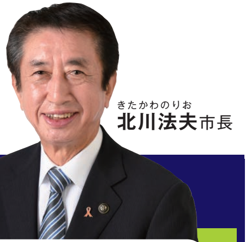
きたかわのりお 北川法夫市長